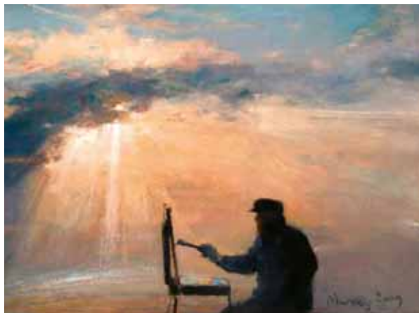
„W światłości”, olej, płótno, 2009 r.