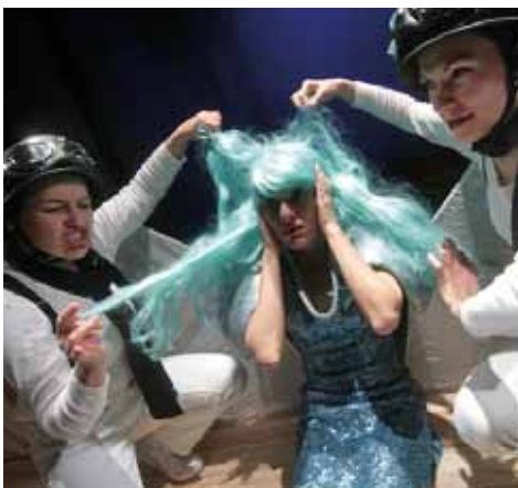
Królestwo Koralowej Rify

9 lutego (niedziela) - godz. 12:30 KRÓLESTWO KORALOWEJ RAFY