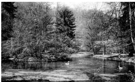
Pelcznica - Łabędzi Staw z wyspką

„Świat” ograniczał się w śląskiej kulturze ludowej do przestrzeni znanej. Wszystko, co znajdowało się poza osadą, należało do świata obcego, często niebezpiecznego. Obok pól, łąk, drzew, zwierząt i domów istniały nad człowiekiem gwiazdy, księżyc i nade wszystko niebo, w którym mieszkało dobro. Na ziemi, a szczególnie pod ziemią, panowało zło. Byli nim strąceni przez Boga aniołowie. Tworzyli oni różne wcielenia zła stając się również demonami wodnymi, leśnymi czy polnymi.