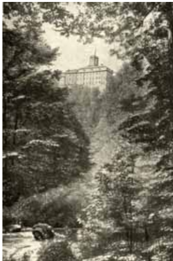
Zamek Książ od strony Pelcznicy

W piękny, majowy dzień, na drodze wiodącej od strony Ślęży pojawiła się charakterystyczna postać – stary, muskularny mężczyzna odziany w strój myśliwego, z długą brodą i włosami oraz sękatym kosturem w dłoni. Zatrzymał się przy karczmie stojącej w środku wsi zwanej Białym Kamieniem. Był to Rübezahl czekający