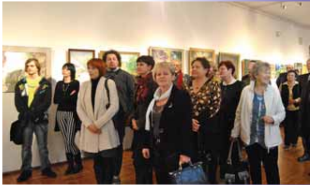
Artyści i goście Triennale