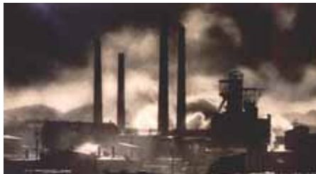
Wałbrzych - nieistniejąca kopalnia Tiefbau przy obecnej ul. Sikorskiego

obyczaju, norm społecznych oraz wartości, wynikających z etosu życia i pracy górniczej braci. Dbał o górników przestrzegając ich