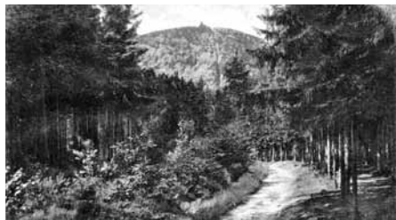
Droga na Chelmiec

Dawnymi czasy okolicę Wałbrzycha zamieszkiwały dziwne skrzaty, zwane przez ludzi Quarkami. Mieszkały w zwietrzałych skałach piaskowca. Były to istoty tak małe, że mogły