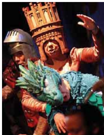
Bajka o Rozczarowanym Rumaku Romualdzie