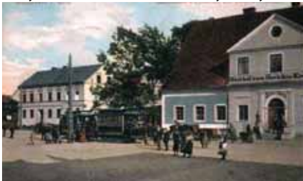
Biały Kamień - restauracja Przy Karczmie Sądowej

Ludzie mieszkający w okolicy Chełmca powiadali, że na najpiękniejszej łące można było spotkać szpetną staruchę, zwaną Tobmetze. Wiedźma ta straszyla już samym swoim wyglądem. Jej brzydota była tak odrażająca, że nikt dłużej niż chwilę nie mógł na nią patrzeć. Potargane włosy Tobmetzy pełne były liści i Bóg wie czego jeszcze, suknia brudna i poszargana, a potężny kostur, którym się stale podpierała, też robił swoje. W Inianym worze, z którym ani na chwilę się nie rozstawała, często nosiła tajemnicze rośliny i zioła. Ponoć знаła lekarstwa na wszystkie choroby. Ludzie bali się jednak staruchy tak bardzo, że nie chcieli ryzykować picia przyrządzonej przez nią mikstury. Bo Tobmetze nie dość, że była brzydka,