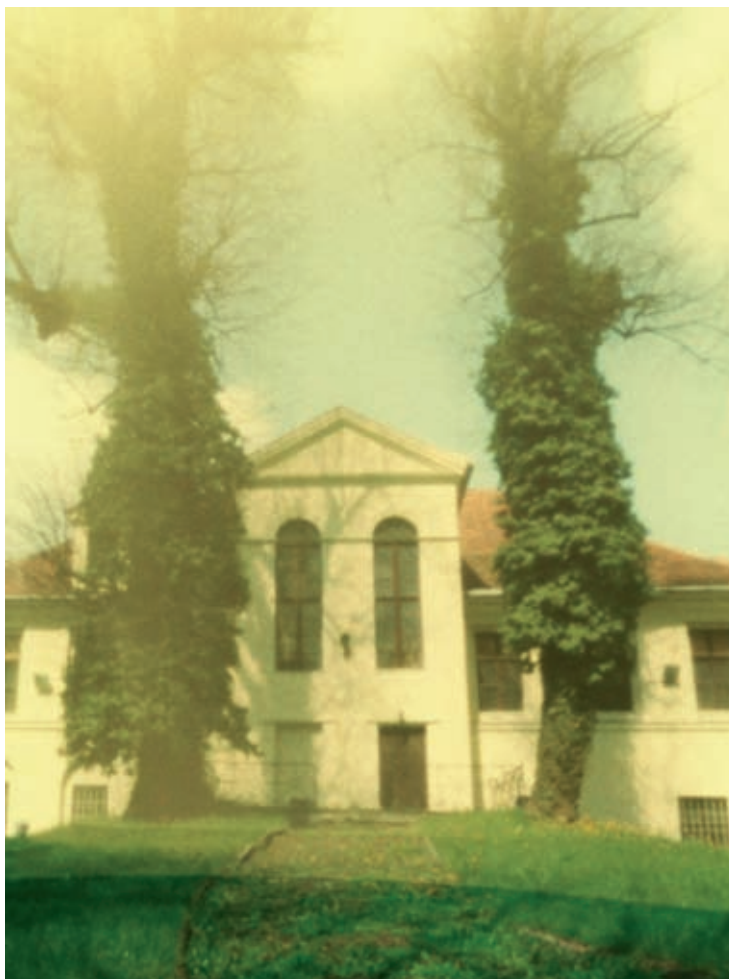
Fotografia otworkowa - Muzeum w Wałbrzychu