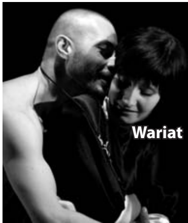
Wariat i zakonnica

chwili, gdy trwały jeszcze próby sztuki. Na zaproszenie Teatru „Maska” w Rzeszowie pokazaliśmy, jako gwiazdę wieczoru, spektakl „Wariat i zakonnica” w ramach cyklicznych spotkań „Piątek pełen kultury”. Napawa nas satysfakcją, że po raz pierwszy walbrzyski Teatr Lalki i Aktora znalazł się na łamach prestiżowego „Teatru”, co ważne – z obszernym, pochlebny omówieniem naszego spektaklu i w tak dobrym towarzystwie - teatru lalek „Baniałuka” w Bielsku Białej i Krakowskiej „Groteski”.