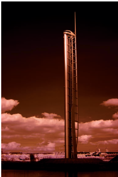
Wieża Science Centre