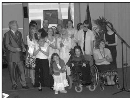
Artyści z Polski