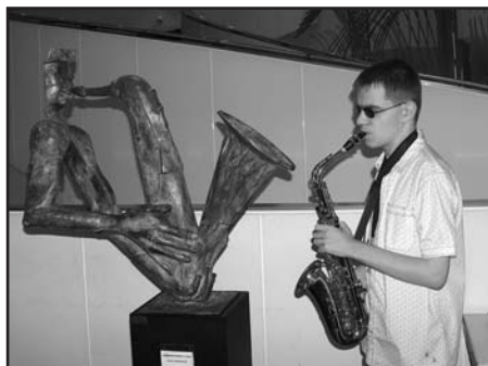
Polsko - belgijski duet saksofonistów