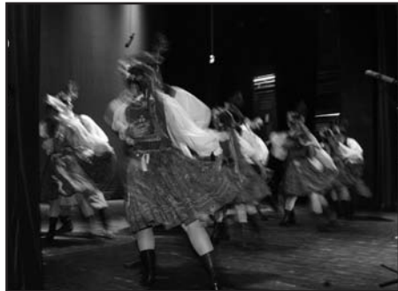
Kalejdoskop opracowała Barbara Szeligowska

Sponsorem wspierającym finansowo realizację koncertu była ENERGIAPRO Oddział w Wałbrzychu.