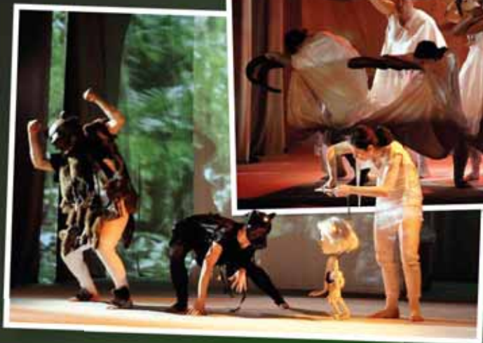
„Księga Dżungli” - Teatr Lalki i Aktora