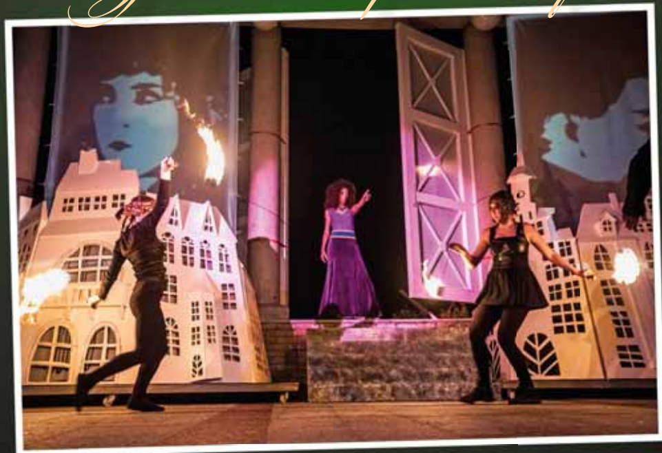
„Miasto duchów” - Teatr Dramatyczny