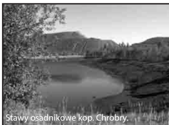
Stawy osadnikowe kop. Chrobry.

Czynne hałdy były źródłem zapylenia powietrza i szpeciły krajobraz. By temu przeciwdziałać, prowadzono rekultywację. Rozpoczęto ją już w latach 30. XX wieku. Przebiegała jednak w różnym tempie z powodu braku środków. Efekty są