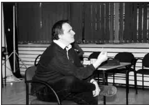
Reżyser - Grzegorz Stawiak