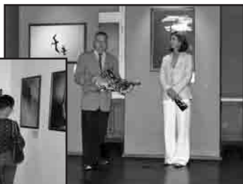
Z otwarcia wystawy.