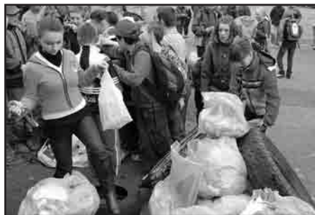
Opracowanie Kalejdoskopu: szela, eka, fot. B. Szeligowska

Konkurem „Ekologiczni wałbrzyszanie” WOK zainaugurował tegoroczne Sprzątanie Świata (czyt. Wałbrzycha). Do ich organizacji włączyli się: Urząd Miasta, Toyota i ALBA.