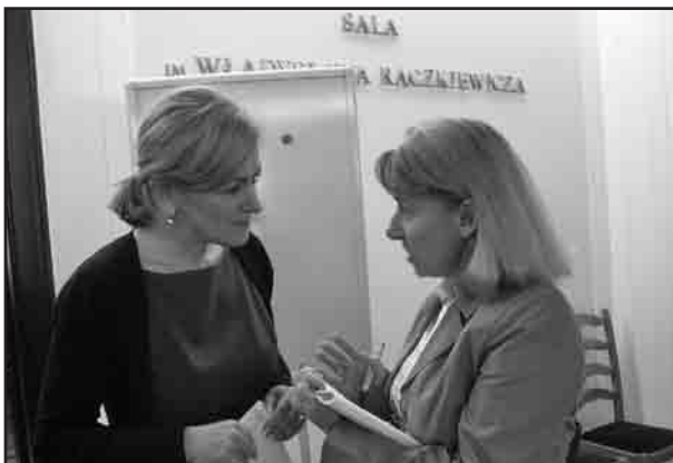
W rozmowie z Krystyną Bochenek, Wicemarszałek Senatu, przewodniczącą konkursowego jury.