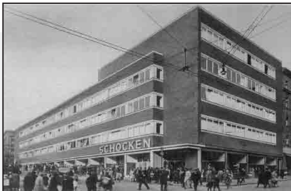
Domy Towarowe w sieci Schockena w Wałbrzychu i w odległym mieście Stuttgart (obok)

W Wałbrzychu powstać mają w najbliższym czasie dwa nowoczesne domy handlowe nazywane również galeriami. W galeriach tych można znaleźć kina, restauracje, wiele sklepów, parkingi. Są to miejsca, gdzie można spędzać miło czas podczas zakupów. Ale... Być może nie wszyscy wiedzą, że dokładnie osiemdziesiąt lat temu rozpoczęła się budowa pierwszego nowoczesnego, wielobranżowego domu handlowego w naszym mieście. Był on wówczas największym domem towarowym w regionie wałbrzyskim.